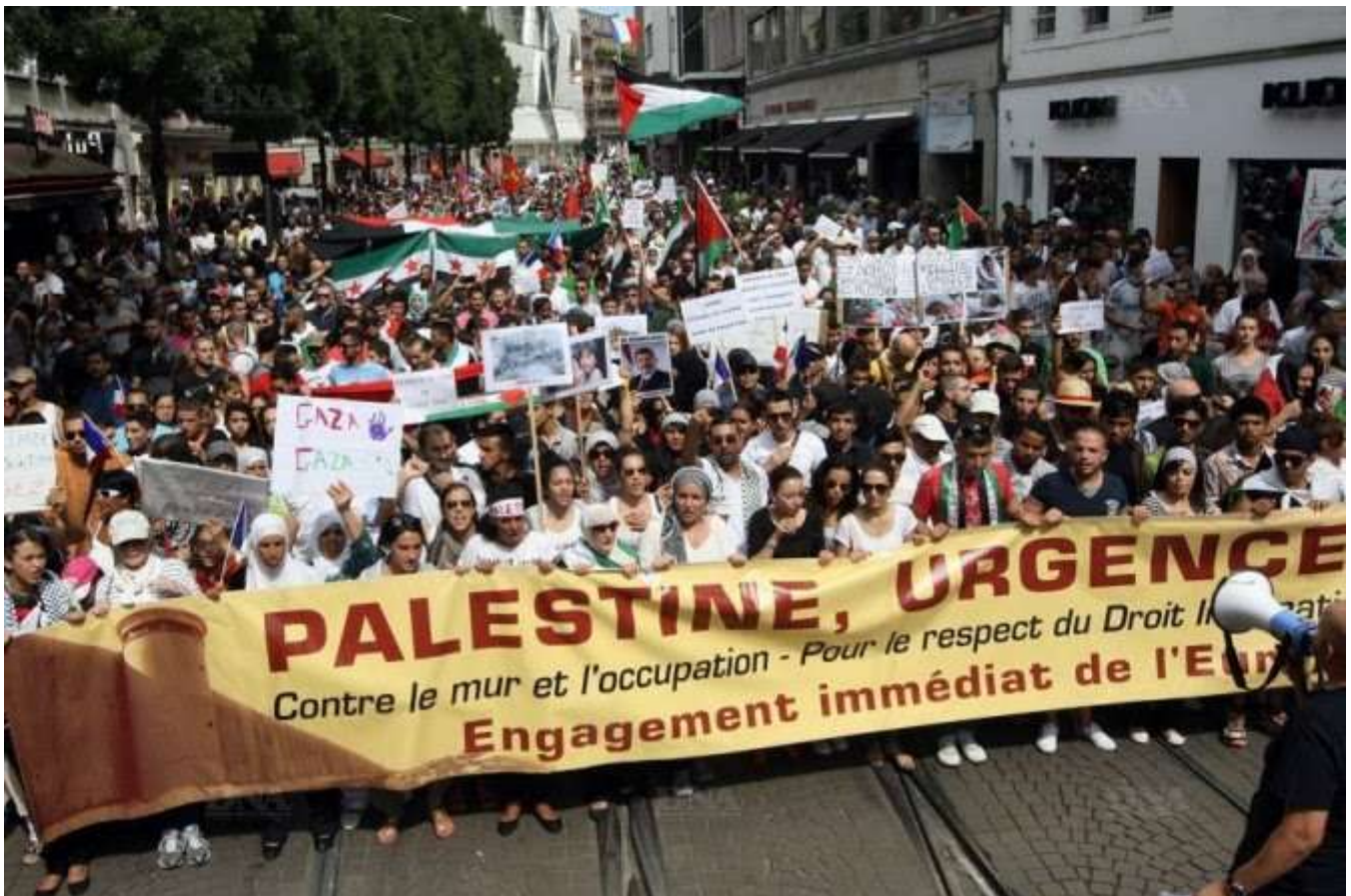
Strasbourg, 3000 personnes le 20 juillet

"nous étions plus d un millier a manifesté samedi a bordeaux malgré l interdiction de la police."