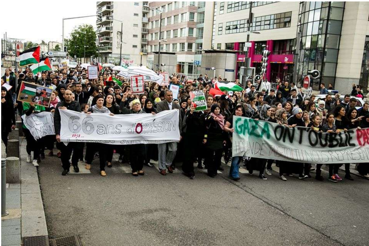
Bordeaux, 14 juillet, 1000 personnes

"nous étions plus d un millier a manifesté samedi a bordeaux malgré l interdiction de la police."